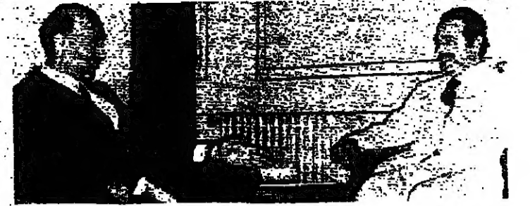
الوزير بطرس خلال الاجتماع مع السفير البيعان